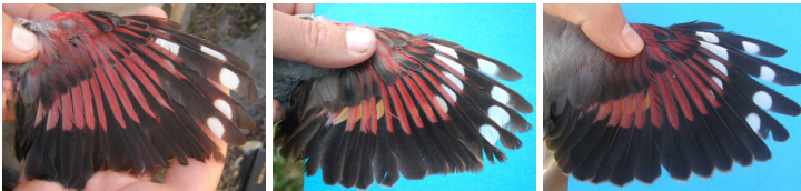
Figura 1. Aspecto del cuerpo, cabeza, garganta y ala de diferentes treparriscos capturados en los Picos de Europa.

en la garganta de extensión variable que puede alcanzar la parte superior del ojo y descender hacia el pecho, aunque puede ser más reducida y no llegar al ojo.