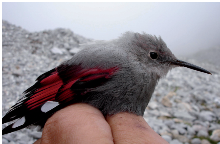
Tabla 2. Longitud de las primarias y primera secundaria (en orden ascendente) del trepariscos en los Picos de Europa. Media±s.d. (tamaño muestral).